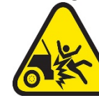
Colisión o vuelco de un vehículo