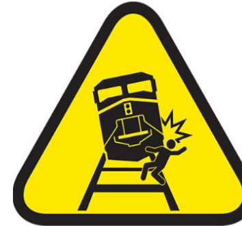
IMPACTO DE TREN A PERSONA