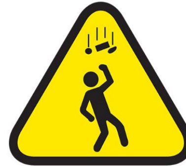
CAIDA DE OBJETOS