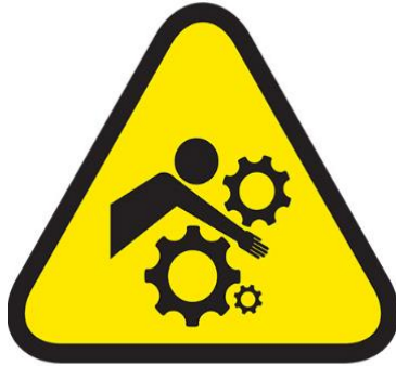
ATRAPAMIENTO / APLASTAMIENTO