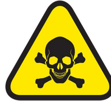
EXPOSICION A SUSTANCIAS PELIGROSAS