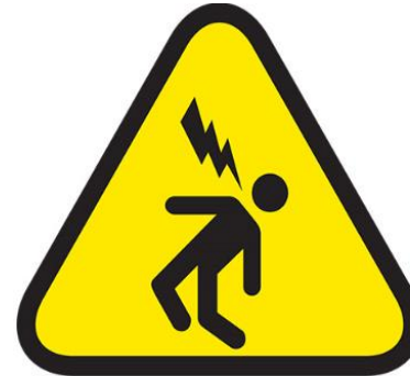
CONTACTO CON ELECTRICIDAD