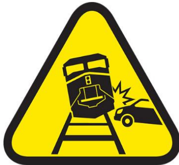
COLISION DE TREN CON VEHICULOS / EQUIPOS