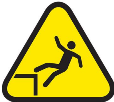
CAIDAS DE DISTINTO NIVEL