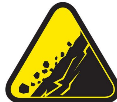
FALLAS DEL TERRENO, DERRUMBES