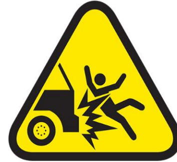
IMPACTO DE VEHICULO A PERSONA