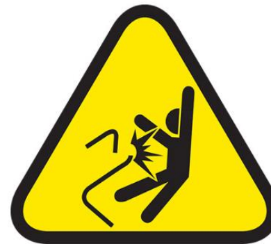
LIBERACION NO CONTROLADA DE ENERGIA