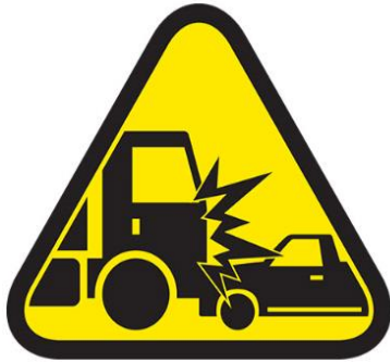
COLISION O VOLCAMIENTO VEHICULAR / EQUIPOS