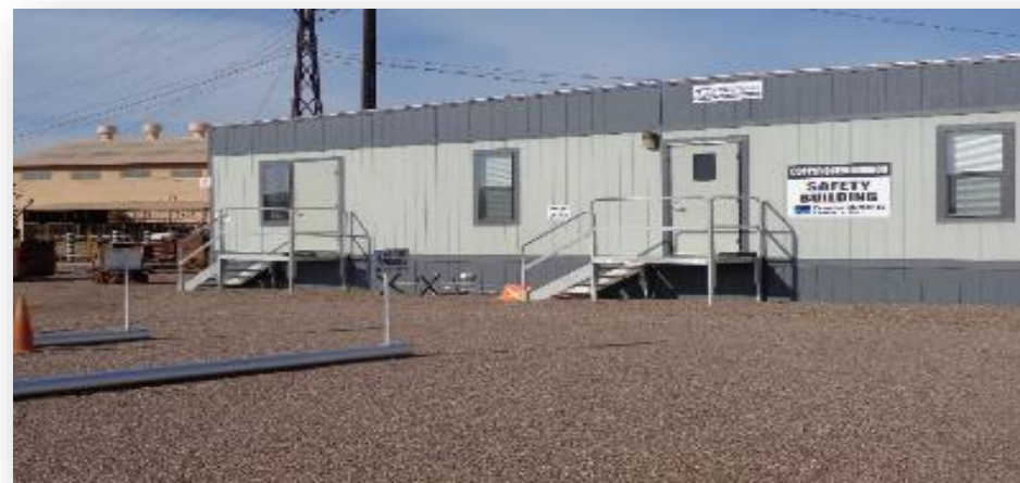
(5) TOQUES DE LA BOCINA DE LA MINA: PRESENTARSE EN EL EDIFICIO DE SEGURIDAD