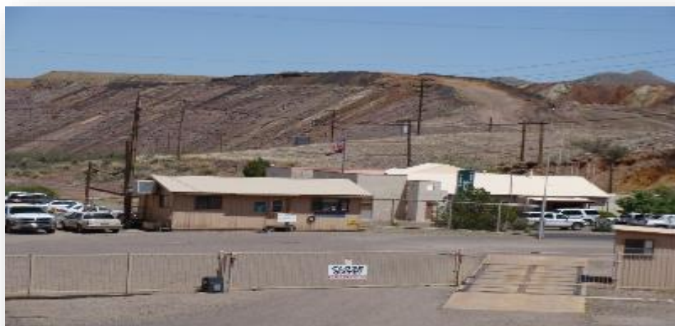
(9) TOQUES DE LA BOCINA DE LA MINA: PRESÉNTASE EN LA CABAÑA DE SEGURIDAD EN LA PUERTA PRINCIPAL