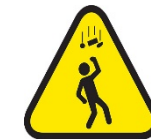
Caída de objetos