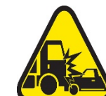
Colisión o vuelco de un vehículo