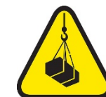
Operaciones de levantamiento