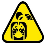
Sustancia peligrosa, exposición crónica