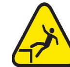
Caída desde las alturas