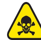
Sustancia peligrosa, exposición aguda