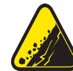
Falla del terreno