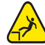
Caída desde las alturas