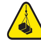
Operaciones de levantamiento