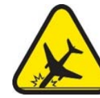
Interacción con aeronaves