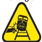
Colisión de rieles