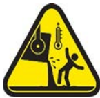
Contacto con material fundido