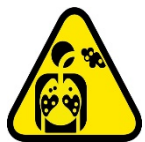
Sustancia peligrosa, exposición crónica