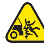
Impacto de un vehículo en una persona