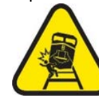
Impacto de rieles en una persona