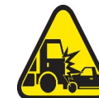
Colisión o vuelco de un vehículo