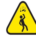
Caída de objetos