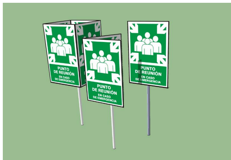
Figura N° 1

Para señalar las zonas de reunión en caso de emergencia se dispondrá de dos alternativas o la combinación de ambas. Una de ellas será a través de un cartel con el pictograma característico de zona de reunión (Ver fig. N°1) y la otra será con el círculo característico de zona de reunión con la letra "S" al interior (Ver fig. N° 2)