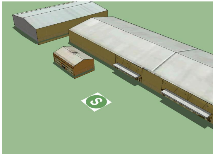
Figura N° 2

Entre la señalización estándar que se utilizará en los interiores de los almacenes, plantas de proceso, talleres y oficinas se encuentran las siguientes: